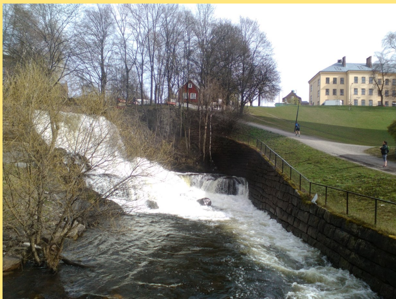
Oslo, Akerselva, Sagene, intill Beirbrua

vi lite fredagsmys med frukt. Självklart blev lite onyttigheter också! Lördagsmorgonen började vi med en härlig frukost. Sen var det dags att hitta på något. Vi tog med broschyrer till rummen och började leta på saker vi kunde göra. Alla ville göra något ute då det var härligt väder. Vi kom överens om att gå längs Akerselva som rinner genom Oslo. Vi gick en bit längs älven. Vi såg många fantastiska for-sar.